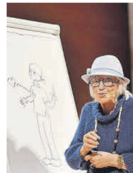
Bayés amb el dibuix que va fer.