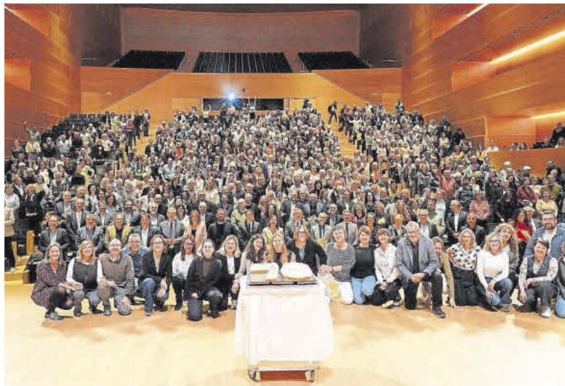
Bufada d'espelmes del pastís commemoratiu del 70è aniversari del Trueta.